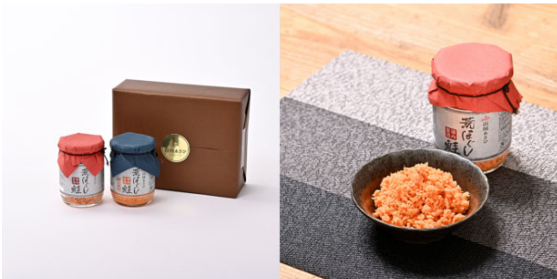
函館あさひ 荒ほぐし鮭／荒ほぐし鮭 明太風味【ギフト包装】