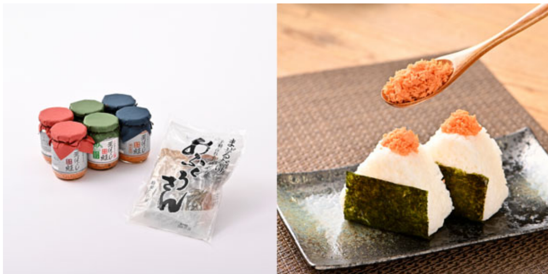
合食のごはんのお供セット

自信作を集めたごはんのお供詰め合わせセットです。アレンジも豊富でご自宅用やギフトにも最適です。